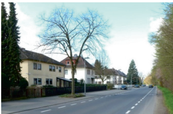
Beidseitige Schutzstreifen (Friedensallee)

Jeder, der seit mindestens einem Jahr im Be-sitz eines Führerscheins ist, kann sich ab sofort per App eines der Autos sichern und nach dem Buchen sofort in „sein“ Fahrzeug einsteigen. Einzige Formalität ist die Anmeldung bei app2drive mit einmaliger persönlicher Identi-fizierung per Führerschein und Personalaus-weis. Dies geschieht per Online-Formular oder persönlich bei einem der app2drive-Partner in Neu-Isenburg (s. www.app2drive.com ). Demnächst wird das Angebot auch noch um ein Elektrofahrzeug erweitert.