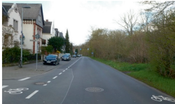
Schutzstreifen und Piktogrammspur (östliche Friedensallee)

Schutzstreifen auf der Fahr-bahn bieten den Radfahrern ein schnelleres Vorankommen und gewährleisten eine hö-here Verkehrssicherheit. Durch diese Maß-nahme rückt der Radfahrer ins Blickfeld des Autofahrers. Die Unfallgefahr wird insbe-sondere an Einfahrten und Kreuzungen ver-mindert, da Radfahrer nicht mehr so leicht übersehen werden können.