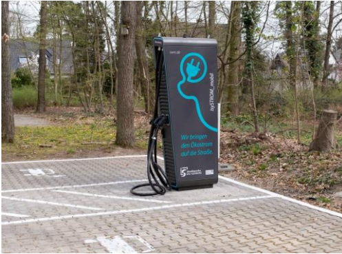
Ladesäule Zeppelinheim

leistung von 150 kW dauert es nur rund 20 Minuten, um einen durchschnittlichen Akku eines E-Fahrzeugs ausreichend mit klimafreundlichem Ökostrom zu laden.