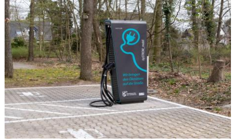
Ladesäule Zeppelinheim

werden. Ladevorgänge sind täglich von 05:00 Uhr bis 23:00 Uhr möglich; in den Nachtstunden ist die Ladestation außer Betrieb.