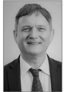
Dirk Gene Hagelstein Bürgermeister