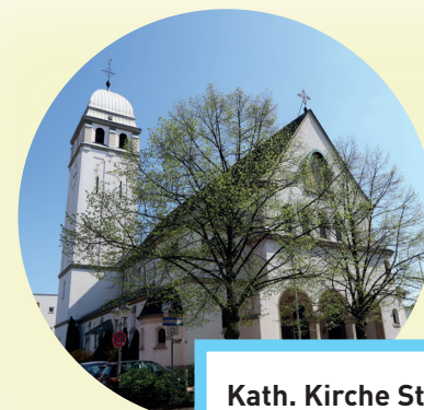
Kath. Kirche St. Josef Kirchstraße 20