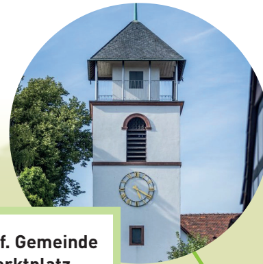
Ev.-ref. Gemeinde am Marktplatz Marktplatz 8