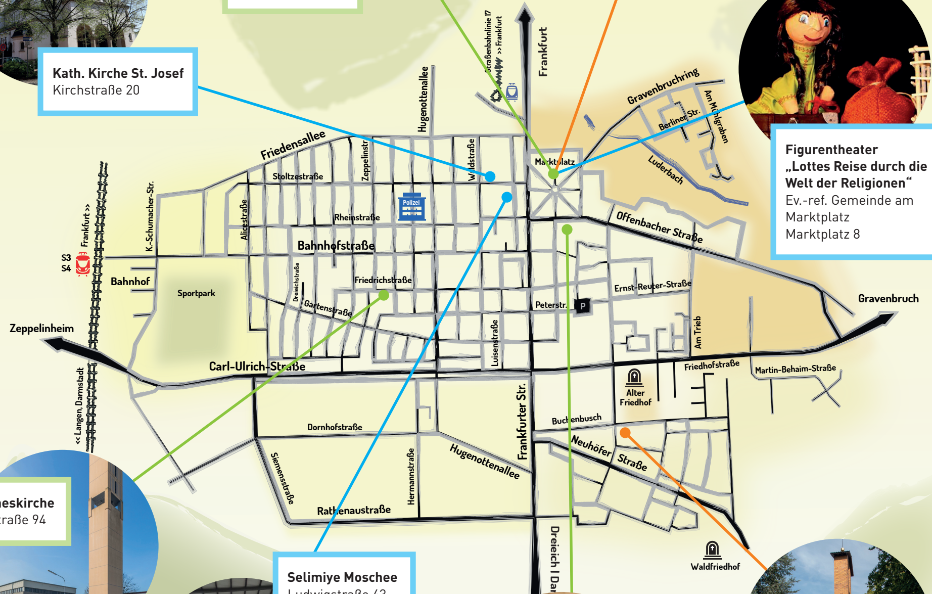
Ev. Johanneskirche Friedrichstraße 94